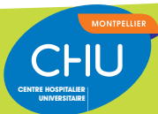
Illustration : p. Delestre Mise en page : Service Communication - CHU de Montpellier - G. Faugier - 07/2018